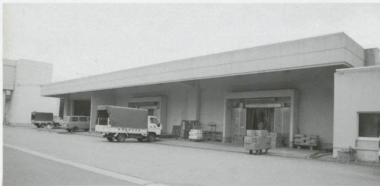
◀低温貯蔵庫 ●昭和56年 ●鉄筋コンクリート造平家建 ●836㎡