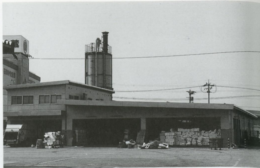
▲クリーンセンター ●昭和61年 ●鉄骨造2階建 ●818m 2