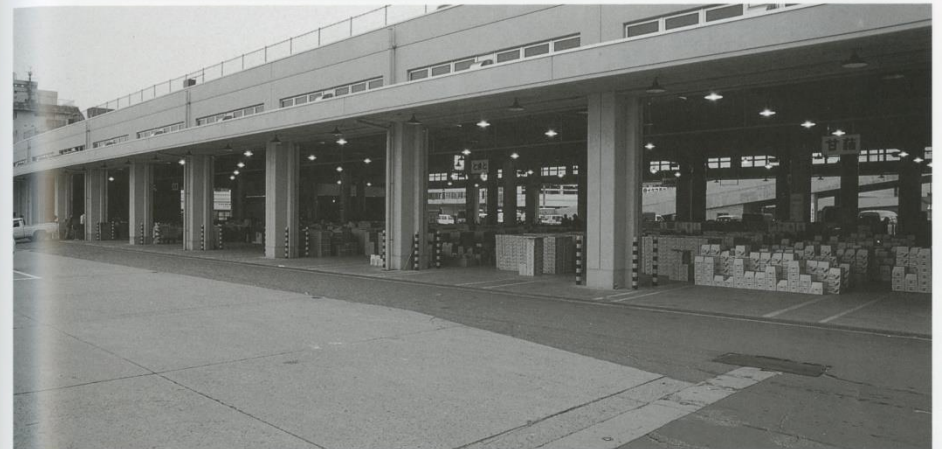
▲青果第3卸売場 ●改築年度 昭和59年 ●鉄骨鉄筋コンクリート造平家建 ●3,282㎡