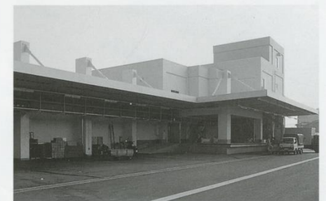
▲冷蔵庫 ●昭和60年 ●鉄筋コンクリート造平家建 ●1,783㎡