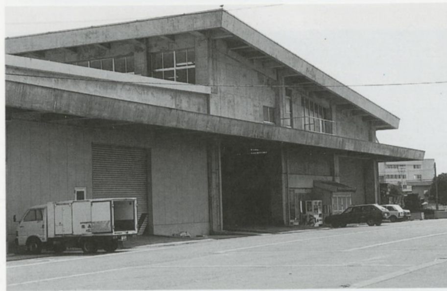
◀水産本館(増築) ●増築年度 昭和62年 ●鉄骨鉄筋コンクリート造2階建 ●5,068m 2