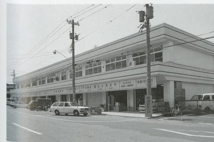
▲乾物店舗 ●改築年度 昭和60年 ●鉄骨造2階建 ●1,210㎡