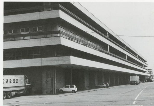
▶第2卸売市場 立体駐車場(増築) ●増築年度 昭和54年

さらに、鮮度保持のため、水産冷蔵庫棟を、青果物低温貯蔵庫棟が新築され、また、市場内で発生するごみ処理、発泡スチロール処理のためのクリーンセンター棟も新築される等、時代時代の要請が開設から23年経過した現在の建築物に感じられる。