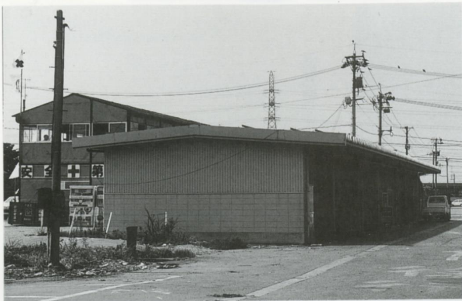
▲活漁場 ●昭和61年 ●鉄骨造平家建 ●249m 2