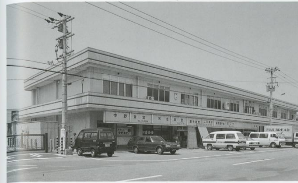
◀関連店舗 ●改築年度 昭和57年 ●鉄骨造2階建 ●3,582㎡